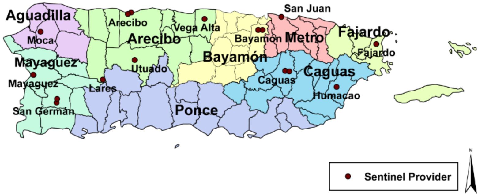
Proveedores sentinelas de ILI Net, 2014